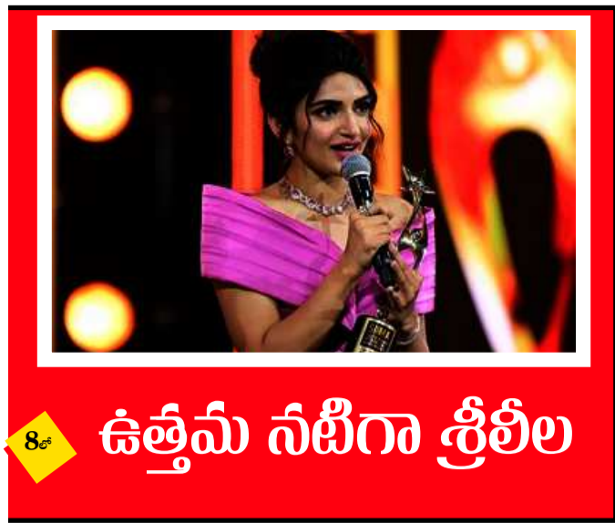
8 లో ఉత్తమ నటిగా శ్రీలీల

ప్రచురణ, తెలంగాణ, సంపుటి -08 సంచిక -12 ఆదివారం 17-9-2023 పేజీలు -4. వేల రూ.2/-