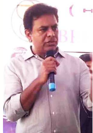
మంత్రి కేటీఆర్ అన్నారు. ఎన్నికలు రాగానే పొలిటికల్ టూరిస్టులు వస్తారు

వరంగల్, అక్టోబర్ 6 జనవాహిని జిల్లా వరంగల్ లో తూర్పు నియోజకవర్గ సంక్షేమ సభలో మంత్రి కేటీఆర్ మాట్లాడుతూ.. ఒకే రోజు 15 వేల మందికి సంక్షేమ పథకాలు మంజూరు చేశారని అందజేసిన ఘనత సీఎం కేసీఆర్ ది అని పేర్కొన్నారు. కేసీఆర్ అంటేనే సంక్షేమం.. పులిని చూసి నక్క వాతలు పెట్టుకున్నట్లు కేసీఆర్ ను చూసి కాంగ్రెస్ బిజీబీ నాయకులు వ్యవహరిస్తున్నారు.. ఎవరో వచ్చి ఏదేదో చేస్తామంటే ఆగం కాకండి అని ఆయన చెప్పారు. తొందరలోనే శుభ వార్త వింటారు.. ఎవరెవరికి ఏం చేయాలో కేసీఆర్ ఆలోచిస్తున్నారు.. ఇప్పటి వరకు చేసింది కేసీఆర్.. మళ్ళీ వచ్చేది కేసీఆర్.. ఏం చేయాలన్నా కేసీఆర్ చేస్తారు అని