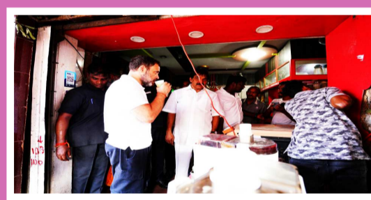
- మినరా 2లో కేసీఆర్