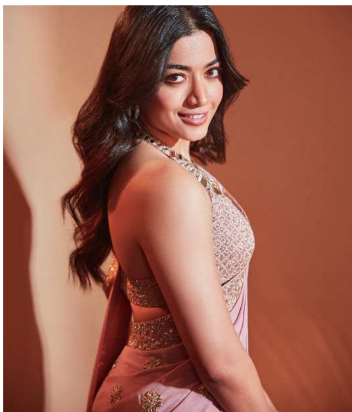
కావాలి అన్న అంశాలతో ఈ సినిమా తెరకెక్కుతోందని, సినిమాకు సంబంధించి మరిన్ని వివరాలను త్వరలోనే తెలియజేస్తామని తెలిపారు.