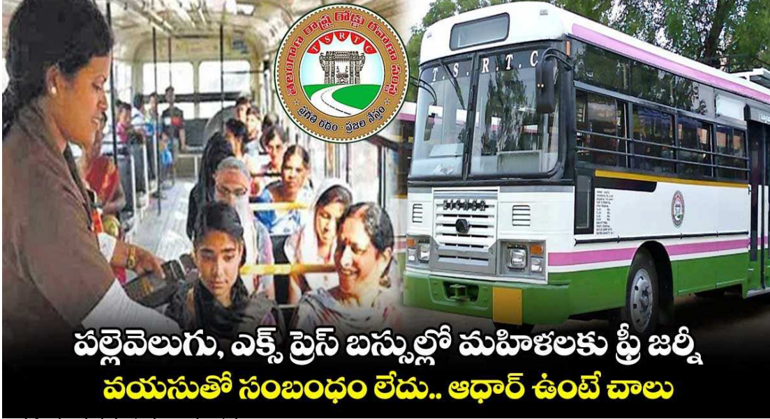
- మహిళల వయసుతో సంబంధం లేదు

- సిటీలో మాత్రం ఆర్డీసీ, ఎక్స్ ప్రెస్ బస్సుల్లో ప్రీ జర్నీ