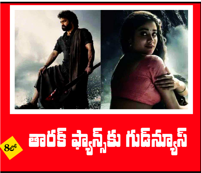
8వ తారీఖ్ షాన్స్ కు గుడ్ న్యూస్