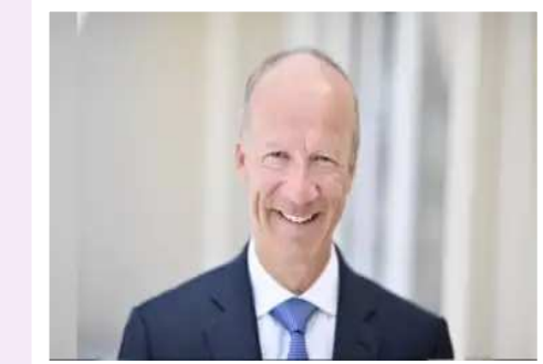
భారత్ లో అత్యధిక వేతనం తీసుకుంటున్న సీఈఓ జాబితాలో ప్రాన్స్ కు చెందిన థియరీ డెలాపోర్ట్ అగ్రస్థానంలో నిలిచారు.