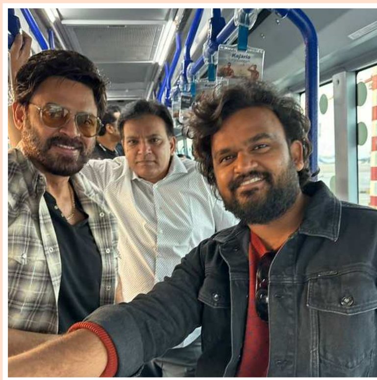
సంక్రాంతి కానుకగా తెలుగు, తమిళం, మలయాళం, కన్నడ, హిందీ భాషల్లో ప్రపంచవ్యాప్తంగా గ్రాండ్ గా విడుదల కానుంది. ఈ నేపథ్యంలో ప్రమోషన్ లో ఈవెంట్ తో బిజీగా ఉంది వెంకీ టీం. చంద్రప్రస్థ ఫిక్షన్ ల్

కలియగ పాండవులు సినీమాతో దగ్గుబాటి ఫ్యామిలీ నుంచి హీరోగా సిల్వర్ స్క్రీన్ పై మెరిశాడు వెంకటేశ్. కామెడీ, ఫ్యామిలీ, యాక్షన్.. ఇలా అన్ని ఎలిమెంట్స్ కూడిన సినీమాలో విస్తారాన్ని అందించడం వెంకీ స్పెషాలిటీ. తన యాక్టింగ్ తో కోట్లాదిమంది అభిమానులను సంపాదించుకున్న వెంకటేశ్ ప్రస్తుతం వెంకీ 75 సినీమాతో బిజీగా ఉన్నాడని తెలిసింది. తాజాగా వెంకీ మామ సినీమాటిక్ జర్నీ సెలబ్రేషన్ ఈవెంట్ నిర్వహించారు. ఈవెంట్ కు మెగాస్టార్ చిరంజీవి ముఖ్యఅతిథిగా హాజరయ్యారు. ఈ సందర్భంగా వెంకీ మామల మాటలు అందరిలో జోష్ నింపాయి. చిరంజీవి ఇక్కడ లేకుంటే నేను సినీమాలు నుంచి తప్పుకొని ఇప్పటికే హిమాలయాలు వెళ్లేవాడినంటూ చెప్పుకొచ్చాడు వెంకటేశ్. చిరంజీవి సుమార్ 9 ఏండ్ల సుదీర్ఘ విరామం తర్వాత ఖైదీ నం 150 సినీమాతో భాక్ బస్టర్ పొట్టు కొట్టడం చూసి.. నా అభిమానులకు వినోదాన్ని వంచడం కొనసాగించాలని ఫిక్స్ అయ్యా. అప్పుడే ఖచ్చితంగా యాక్టింగ్ కొనసాగించాలని అనుకున్నా. యాక్టింగ్ ఇక ఆపను అంటూ వెంకీ మామ నుంచి ఆసక్తికర కామెంట్స్ వచ్చేసరికి ఆడిటోరియం అంతా అరుపులు, విజిల్స్, ప్రశంసలతో హోరెత్తిపోయింది. వెంకటేశ్ కాంపౌండ్ నుంచి యాక్షన్ ఫ్రెడ్లర్ జోనర్ లో వస్తోన్న సైంధవ్ చిత్రానికి హిట్ ఫేం శైలేష్ కాలను దర్శకత్వం వహిస్తున్నారు. సైంధవ్ జనవరి 13న