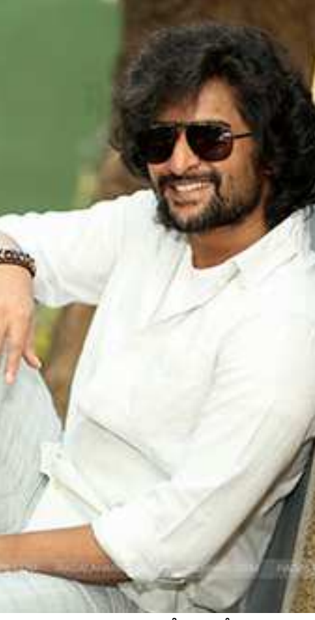
మలయాళం, హిందీ భాషల్లో ఈ చిత్రాన్ని విడుదల చేస్తామని నిర్మాతలు చెప్పారు.