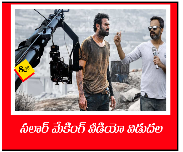
సీలార్ మేకింగ్ వీడియో విడుదల