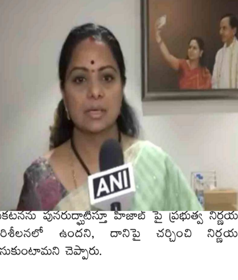
ప్రకటనను పునరుద్ధరిస్తూ పాజిటివ్ పై ప్రభుత్వ నిర్ణయం పరిశీలనలో ఉందని, దానిపై చర్చించి నిర్ణయం తీసుకుంటామని చెప్పారు.