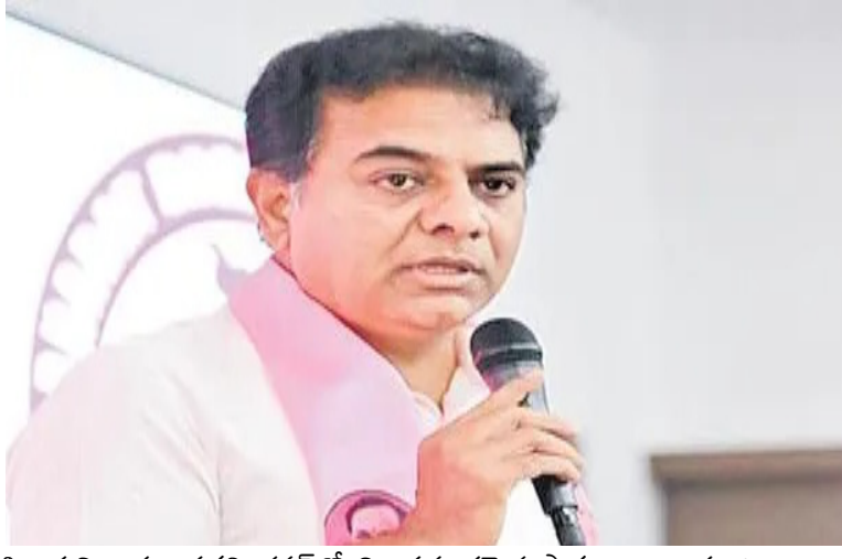
పిలుపునిచ్చారు. ప్రగతి భవన్లో విలాసవంతమైన సౌకర్యాలున్నాయంటూ దుష్ప్రచారం చేశారని, ఇప్పుడు డిప్యూటీ సెం భట్టి అందులోనే ఉంటున్నారని, అక్కడ విలాసాలే ఉంటే.. ఆయన టాం టాం వేసేవారు కదా అని అన్నారు.

200 యూనిట్లలోపు వచ్చిన విద్యుత్ బిల్లులను జనవరి నుంచి కట్టాడని సీఎం రేవంత్ రెడ్డి, మంత్రి కోమటిరెడ్డి వెంకటరెడ్డి గత సవంబరు నుంచే అన్నారని కేటీఆర్ తెలిపారు. ప్రస్తుతం తాను వారి మాటలనే గుర్తు చేస్తున్నానని పేర్కొన్నారు. తాను కరెంటు బిల్లులు కట్టాడంటే విధ్వంసకర మనస్తత్వం అని అంటున్నారని మండి పడ్డారు. నిజాలు మాట్లాడితే విధ్వంసకర మనస్తత్వమా అని కేటీఆర్ ప్రశ్నించారు. ఇక నుంచి కరెంటు బిల్లులను కాంగ్రెస్ నేత సోనియా గాంధీకి పంపుదామని, ఇందుకోసం బీఆర్ఎస్ ఎమ్మెల్యేలు, నాయకులు, కార్యకర్తలు సమాయత్యం కావాలన్నారు. నిరుద్యోగ భృతిపై తప్పించుకున్నట్లే.. పాలమూరు- రంగారెడ్డి జాతీయ హెరాడాపై కాంగ్రెస్ మాట మార్చిందని మండిపడ్డారు. ఎన్నికల ముందు ఇచ్చిన హామీలను అమలు చేయకుండా తప్పించుకునే ప్రయత్నం చేస్తోందన్నారు. హామీలను పూర్తిస్థాయిలో అమలు చేసే విధంగా.. ఇప్పటి నుంచే రాష్ట్ర ప్రభుత్వంపై ఒత్తిడి తేవాలని కార్యకర్తలకు సూచించారు. కాంగ్రెస్ సర్కారు తీరును ఎండగట్టేందుకు సమాచార హక్కు (ఆర్టిఐ) చట్టాన్ని వాడుకోవాలని పార్టీ శ్రేణులకు సమాచార హక్కు (ఆర్టిఐ) చట్టాన్ని వాడుకోవాలని పార్టీ శ్రేణులకు