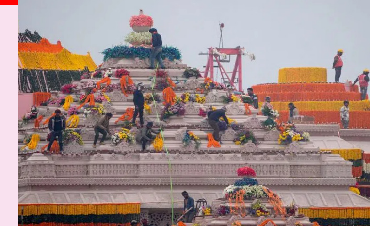
జనవరి 2024)న జరుగుతుంది.

ఎ ఎన్నో శతాబ్దాల కల సాకారం కాబోతున్నది. జన్మస్థలమైన అయోధ్యలో రామ మందిరంలో స్వామివారి సాక్షాత్కరం కాబోతున్నది. మరికొన్ని గంటల్లో జరిగే ప్రాణ ప్రతిష్ఠ వేడుక జరుగనున్నది. ఇందుకు శ్రీరామజన్మభూమి క్షేత్ర ట్రస్ట్ అన్ని ఏర్పాట్లు చేసింది. వేడుకకు అలయాన్ని సర్వాంగ సుందరంగా తీర్చిదిద్దింది. భారత్తో పాటు యావత్ ప్రపంచ దేశాలు ప్రాణ ప్రతిష్ఠ చారిత్రక ఘట్టం కోసం ఎదురుచూస్తున్నది. సోమవారం ప్రాణ ప్రతిష్ఠ కార్యక్రమం ఎలా జరుగుతుంది.. ఏయే క్రతువులు నిర్వహిస్తారో తెలుసుకునేందుకు అందరూ ఆసక్తి చూపుతున్నారు.