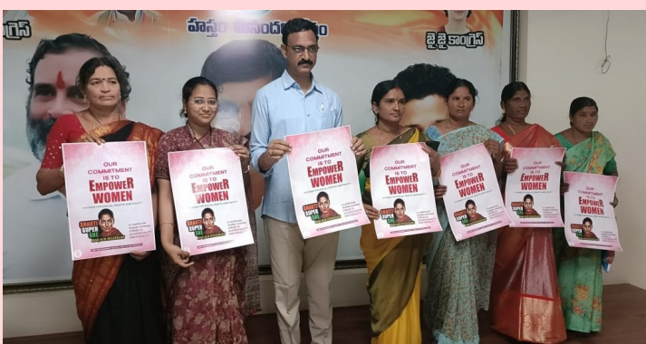
ఖమ్మం జిల్లా జనపహిణి ప్రతినిధిఖమ్మం: