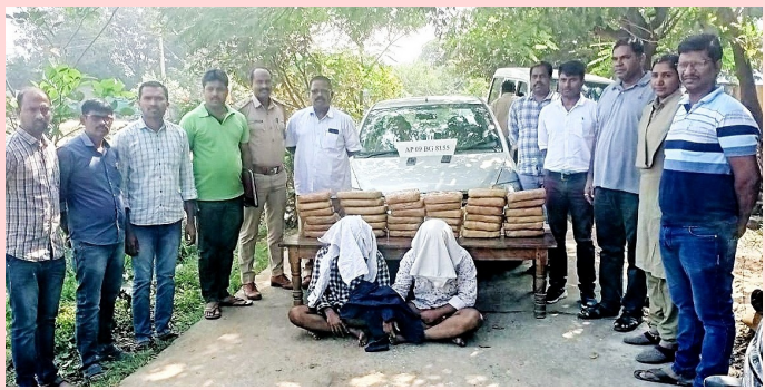
భద్రాద్రి కొత్తగూడెం జిల్లాజనపహిణి ప్రతినిధి