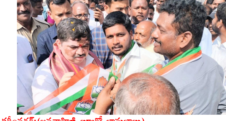
కరీంనగర్