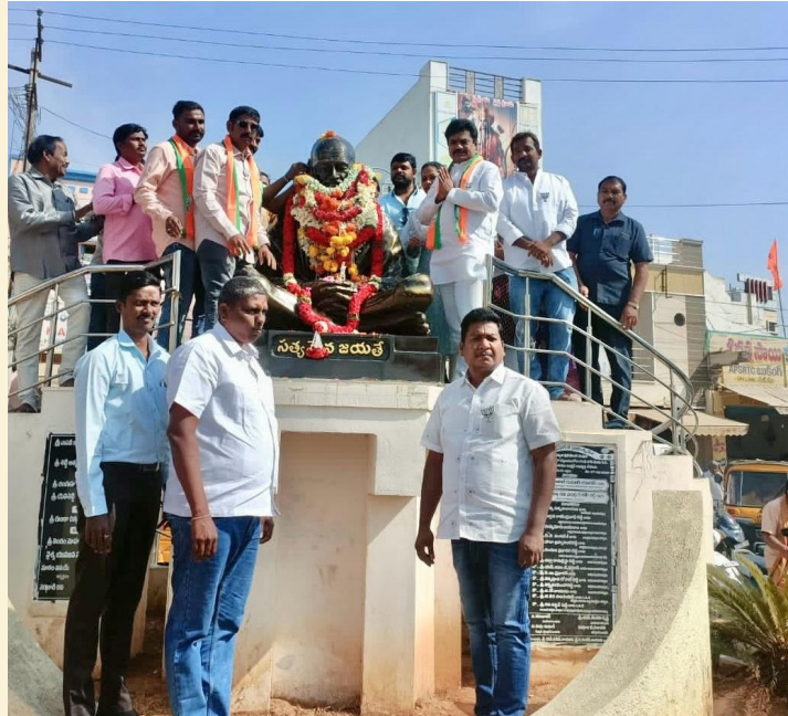
నంద్యాల ప్రతినిధి. జనవరి 30. జనవాహిణి న్యూస్.