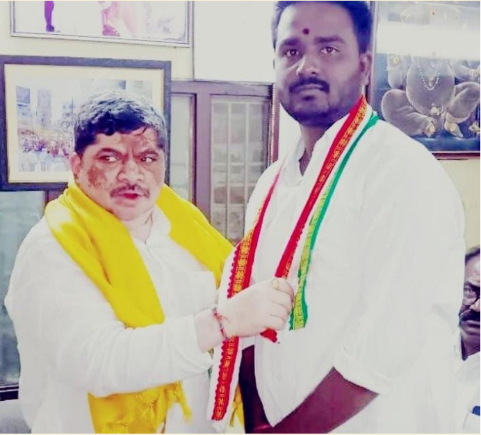
(తాటు దిలీప్ హుస్సాబాద్ రిపోర్టర్)