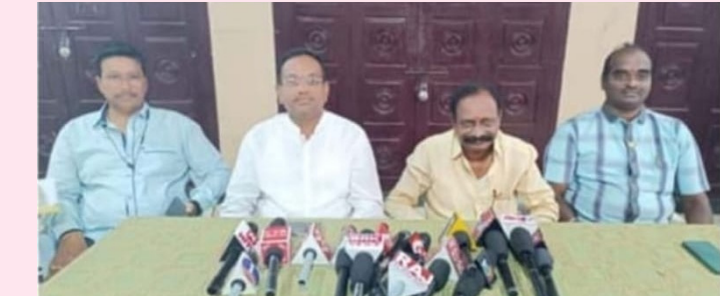
నంద్యాల ప్రతినిధి. జనవరి. జనవాహిణి న్యూస్.

- ఫిబ్రవరి 1న నంద్యాల జిల్లా ఆర్యవైశ్య సంఘం ప్రమాణస్వీకారం.