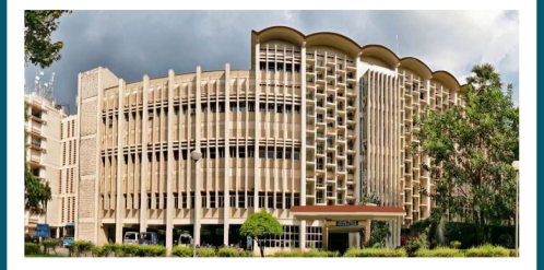
హాజరు కాగా, ఇందులో 1,188 మంది ఉద్యోగాలు సాధించారు. ఇందుకో కూడా ఎక్కువమంది ఇంజనీరింగ్ అండ్ టెక్నాలజీ విభాగంలో ఉద్యోగాలు సాధించారు.

భారతదేశంలో అత్యంత ప్రతిష్టాత్మక విద్యార్థి సంస్థల్లో ఒకటైన బాంబే, ఐఐఐఐ (ఇండియన్ ఇన్స్టిట్యూట్ ఆఫ్ టెక్నాలజీ) 2023-24 ఫ్లైమ్మెంట్ సీజన్ ఫేజ్-1లో 85 మంది విద్యార్థులు రూ. 1 కోటి కంటే ఎక్కువ వార్షిక ప్యాకేజీలతో జాబ్ ఆఫర్లను పొందారు. దీనికి సంబంధించిన చురిన్సి వివరాలు ఈ కథనంలో తెలుసుకుందాం. ఐఐఐఐ బాంబే ఇన్స్టిట్యూట్ రిక్రూట్మెంట్ డ్రైవ్లో మొత్తం 388 డిజిటల్, అంతర్జాతీయ సంస్థలు పాల్గొన్నాయి. ఇందులో యాక్సెంట్, ఎయిర్ బెస్, యాపిల్, బారక్లెస్, గూగుల్, ఔపెన్ మోర్గాన్ చెజ్, మైక్రోసాఫ్ట్, టాటా గ్రూప్ వంటి ప్రముఖ రిక్రూటర్లు ఫ్లైమ్మెంట్ ప్రక్రియలో భాగంగా ఉన్నారు. రిక్రూట్మెంట్లో 1,340 మంది విద్యార్థులు