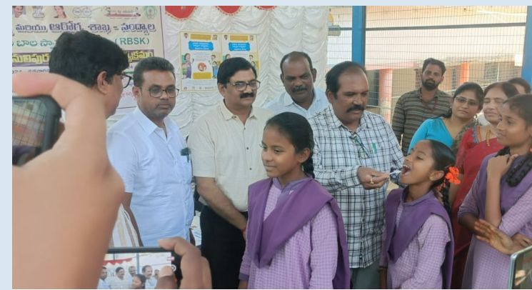
పంద్యాల ప్రతినిధి. ఫిబ్రవరి 9, జనవాహిణి స్టూన్.

పల్లణంలోని మునిసిపల్ గర్ల్స్ హైస్కూల్ నందు ఎన్.డి.డి ప్రోగ్రాం (జాతీయ సులి పురుగుల నిర్మూలన కార్యక్రమం) జిల్లా వైద్య మరియు ఆరోగ్యశాఖ వారి ఆధ్వర్యంలో నిర్వహించడం జరిగింది. ఈ సందర్భంగా వారు మాట్లాడుతూ సులి పురుగులు ఉన్న పిల్లల్లో రక్షాసేవ, పోషకాల లోపం ఏర్పడుతుంది. ఎక్కువగా అలసిపోవడం, కడుపునొప్పి, వికారం, వాంతులు, విరేచనాలు వంటి వాటితో పాటు బరువు కోల్పోతారు. ఆల్బిందజోల్ మాత్రలు తీసుకోవడం ద్వారా ఈ సమస్యల బారిన పడకుండా రక్షించుకోవచ్చన్నారు. 19 ఏళ్ల లోపు పయస్సుగల వారందరికీ ఒకేసారి మాత్రలు మింగించడం ద్వారా ఈ పురుగులను వ్యాప్తిచేసే బాక్టీరియాను నిర్మూలించ వచ్చన్నారు. పిల్లలు వ్యక్తిగత పరిశుభ్రత పాటించడం, ఆహారం తీసుకునే ముందు చేతులు నబ్బుతో శుభ్రం చేసుకోవడం వంటి మంచి అలవాళ్లు ద్వారా 95 శాతం నోటి ద్వారా వచ్చే వ్యాధులను నివారించవచ్చన్నారు. ఈ కార్యక్రమంలో డివై డిఎంపాచ్ఓ