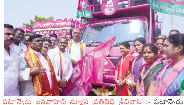
పటాన్యెరు జనవాహిని న్యూస్ ప్రతినీధి శ్రీనివాస్ :- పటాన్యెరు నియోజకవర్గం పటాన్యెరు మండలం రుద్రారం గ్రామ