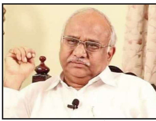
నెల 17న ఉభయ రాష్ట్రాలతో హోంశాఖ ఈ