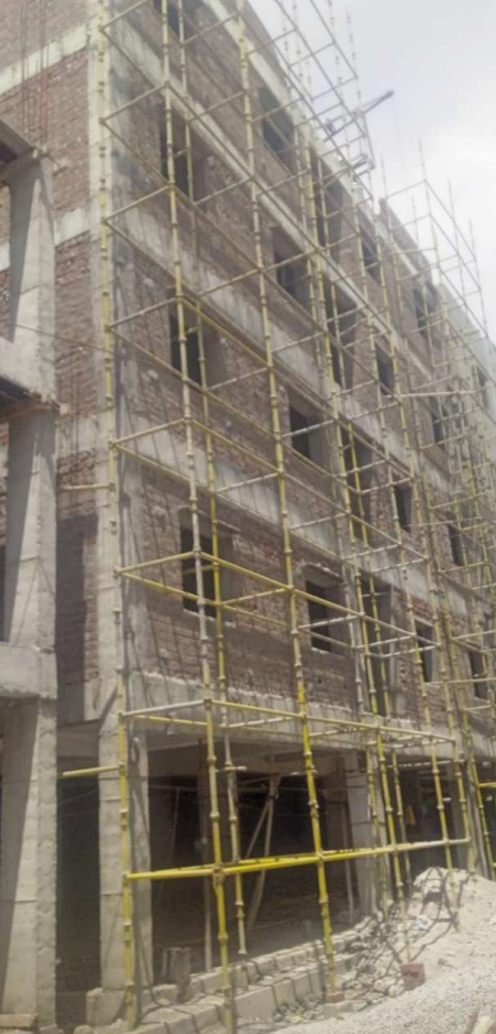
పటాన్యేరు జనవాహిని న్యూస్ ప్రతినిధి

శ్రీనివాస్ :- పటాన్ చేరు నియోజకవర్గ పరిధిలోని ఇంద్రేశం కిష్టారెడ్డిపేట గ్రామపంచాయతీ పరిధిలో గల అక్రమ నిర్మాణాలకు అడ్డు అదుపు లేకుండాపోతుంది. అక్రమ కట్టడాలు జోరుగా సాగుతున్నాయి. నియంత్రించాల్సిన పంచాయతీ అధికారులు తూతూ మంత్రంగా నోటీసులు జారీ చేసి తమకేమీ పట్టనట్టుగా, వ్యవహరించడం అక్రమ నిర్మాణ దారులు వారి వారి పనులను వారు కాని చేస్తున్నారు. గ్రామ కార్యదర్శి వారి నిర్మాణం పట్ల చోద్యం చేస్తున్నారు. ఇళ్ల నిర్మాణాలు గ్రామపంచాయతీ నిబంధనల ప్రకారం వారు జి ప్లన్ టు ఫ్రంట్ హాజ్ కి అనుమతి ఉండగా కానీ వారు బహుళ అంతస్తులు నిర్మిస్తూ నిబంధనలు పాటించడం లేదు. భవనాలు నిర్మించే ముందే బోర్డు వేయడం సాధారణంగా మారింది. అందుకు అనుమతులు ఇవ్వాలైన రెవెన్యూ అధికారులకు ఎంతో కొంత ముట్టచెప్పడంతో రాత్రి వేల బోర్డు వేసుకోవాలని అధికారులే ఉచిత సలహా ఇవ్వడం గమనార్హం. పటాన్ చేరు పారిశ్రామిక ప్రాంతం కావడంతో వివిధ రాష్ట్రాల నుండి ఉపాధి నిమిత్తం పటాన్ చేరు