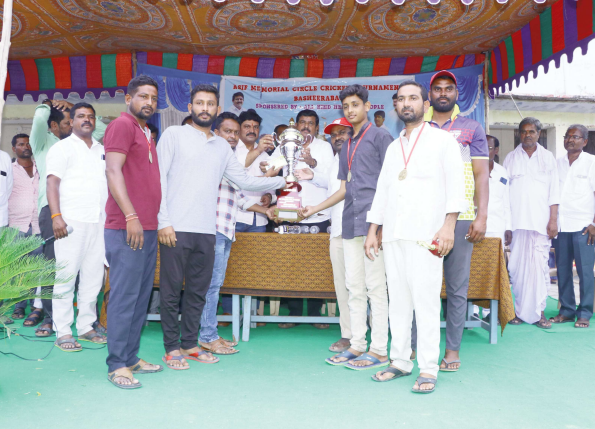
జనవాణిని న్యూస్ బడిరాబాద్ మండల ప్రతినిధి జూన్ 11