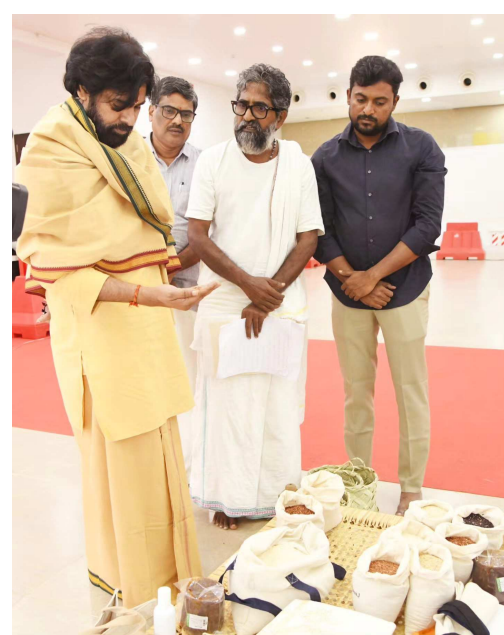
చేసిన కవర్ లో ఇవ్వడం సరికాదు. ప్రసాదాల

అమరావతి,జూలై 8 మరికొన్ని రోజుల్లో వినాయక చవితి పండగ రానున్న నేపథ్యంలో వేడుకల్ని పర్యావరణహితంగా చేసుకు వాలని జనసేన అధినేత, ఏపీ డిప్యూటీ సీఎం పవన్ కల్యాణ్ ప్రజలకు పిలుపునిచ్చారు. వినాయక చవితి రోజున మట్టి వినాయకుడినే పూజించేలా ప్రజలకు అవగాహన కల్పించాలని అధికారులకు పవన్ ఆదేశించారు. పితాపురంలో మట్టి వినాయకుడి విగ్రహం లతోనే పూజలు జరిపేలా ఏర్పాటు చేయాలని సూచించారు.